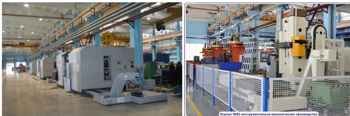
Производственные цеха ЗАО «Невский Завод»

Балтийский заводы), предприятие получило в Морском ведомстве заказы на постройку броненосных кораблей и гражданских судов.