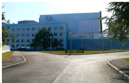
ЗАО «Невский Завод»

Предприятия, входящие в состав ЗАО «РЭПХ», успешно прошли сертификацию в российских и зарубежных органах по сертификации, на всех предприятиях внедрена интегрированная система менеджмента качества и экологического менеджмента.