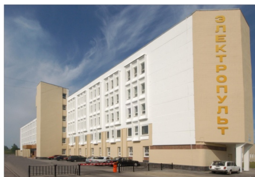
ОАО «Завод ЭЛЕКТРОПУЛЬТ»

В 1909 г. построены ледокольные суда "Таймыр" и «Вайгач», которые в августе 1913 г. под командованием капитана II ранга Бориса Вилькицкого открыли архипелаг Северная Земля, сделав последнее крупное гидрографическое открытие в истории человечества. Подготовкой первой гидрографической экспедиции с целью исследования