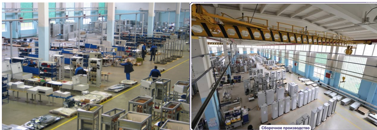
Производственные цеха ОАО «Завод ЭЛЕКТРОПУЛЬТ»

Всего до Октябрьской революции было построено 174 судна и корабля различного назначения.