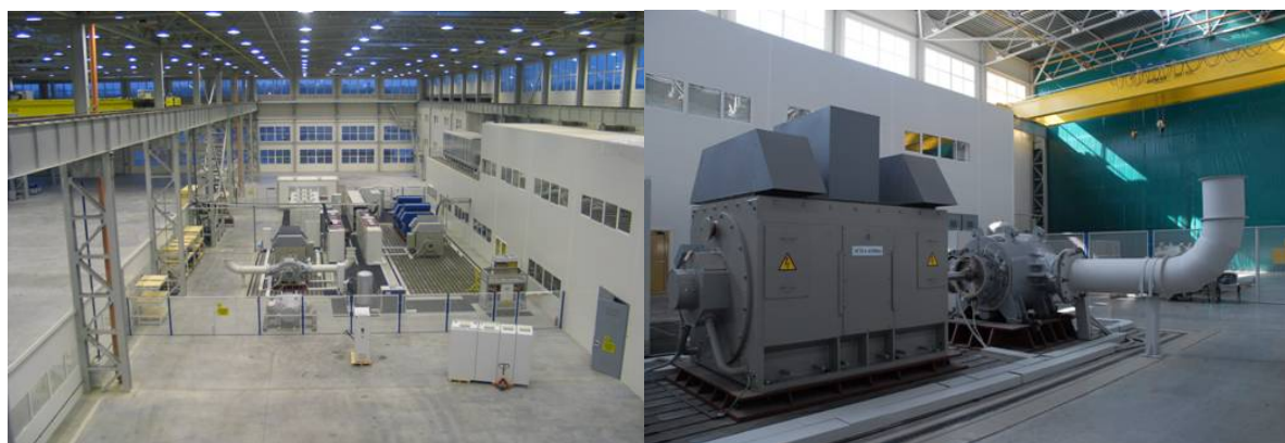
Электротехнический испытательный стенд ОАО «Завод ЭЛЕКТРОПУЛЬТ»

В 2008 году было создано и вошло в состав Холдинга ЗАО «Научно-производственный центр «Электродвижение судов». НПЦ «Электродвижение судов» является разработчиком и совместно с предприятиями Холдинга поставщиком судового электрооборудования и электротехнических систем. Основными направлениями деятельности фирмы является проектирование и комплексные поставки судовых систем электродвижения, судовых электроэнергетических систем, судового электрооборудования и систем управления судовыми техническими средствами.