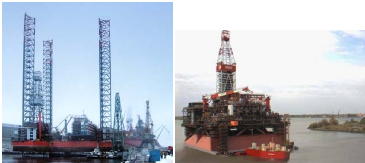
СПБУ «Арктическая» и ледовая стационарная платформа ЛСП-1

эксплуатации автоматизированной системы управления техническими средствами СПБУ «Арктическая».